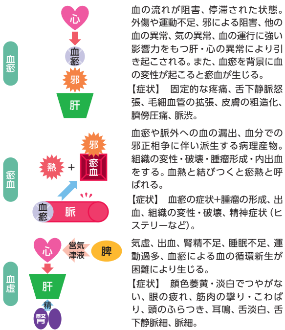
図2 血の病証－血瘀、瘀血、血虚－

気虚はエネルギーの低下であり、生理機能の低下、倦怠感や息切れ、声に力がない、活力の低下、冷え等の症状が現れる。一方で血虚は、営気と津液の不足であり、気の働きが円滑にできない症状(筋肉のこわばり、眼の疲れ、神経の過敏)と、栄養状態の悪化による症状(爪が割れやすい、皮膚や毛髪が潤いがない、月経量の低下、動けるが休むと疲れて動けない)が現れる。現代医学における有症状性の貧血の症状は、気血両虚の症状と捉えることができ、漢方医学的にはより軽度の症状としての血虚を認識している。